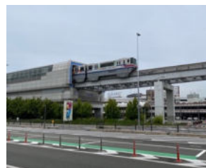
大阪空港駅 (大阪モノレール線)