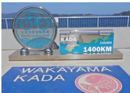
太平洋岸自転車道終点モニュメント (和歌山市加太)

すさみ町 http://www.town.susami.lg.jp/ (2023年8月検索)