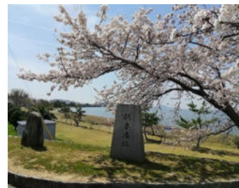
朝妻湊跡(米原市朝妻筑摩)